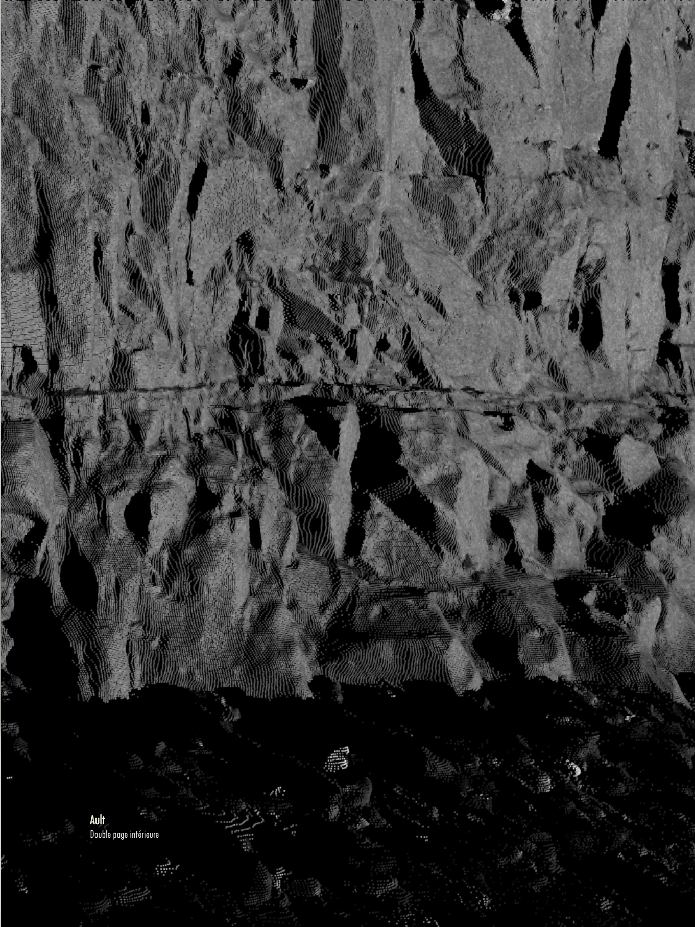
Ault Double page intérieure