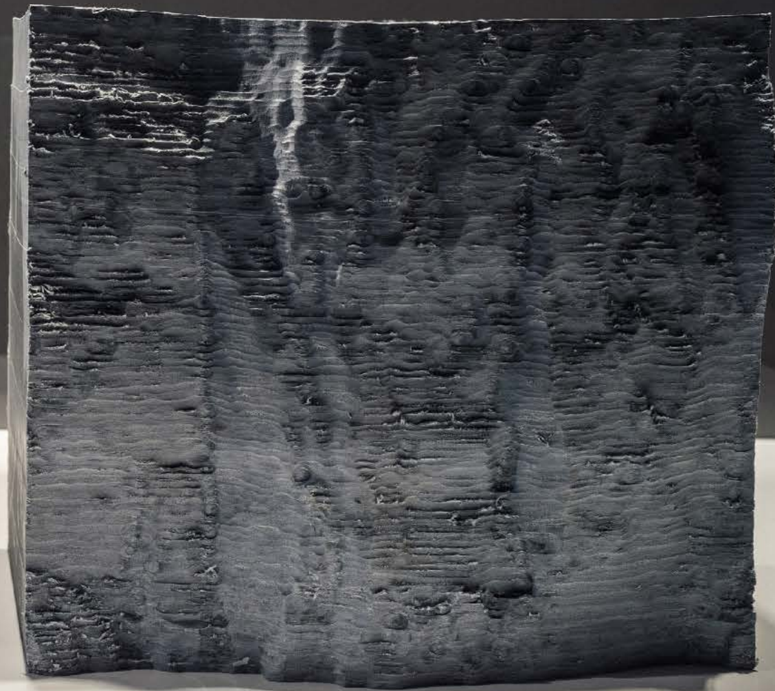
Ault Cercle Cité 2019